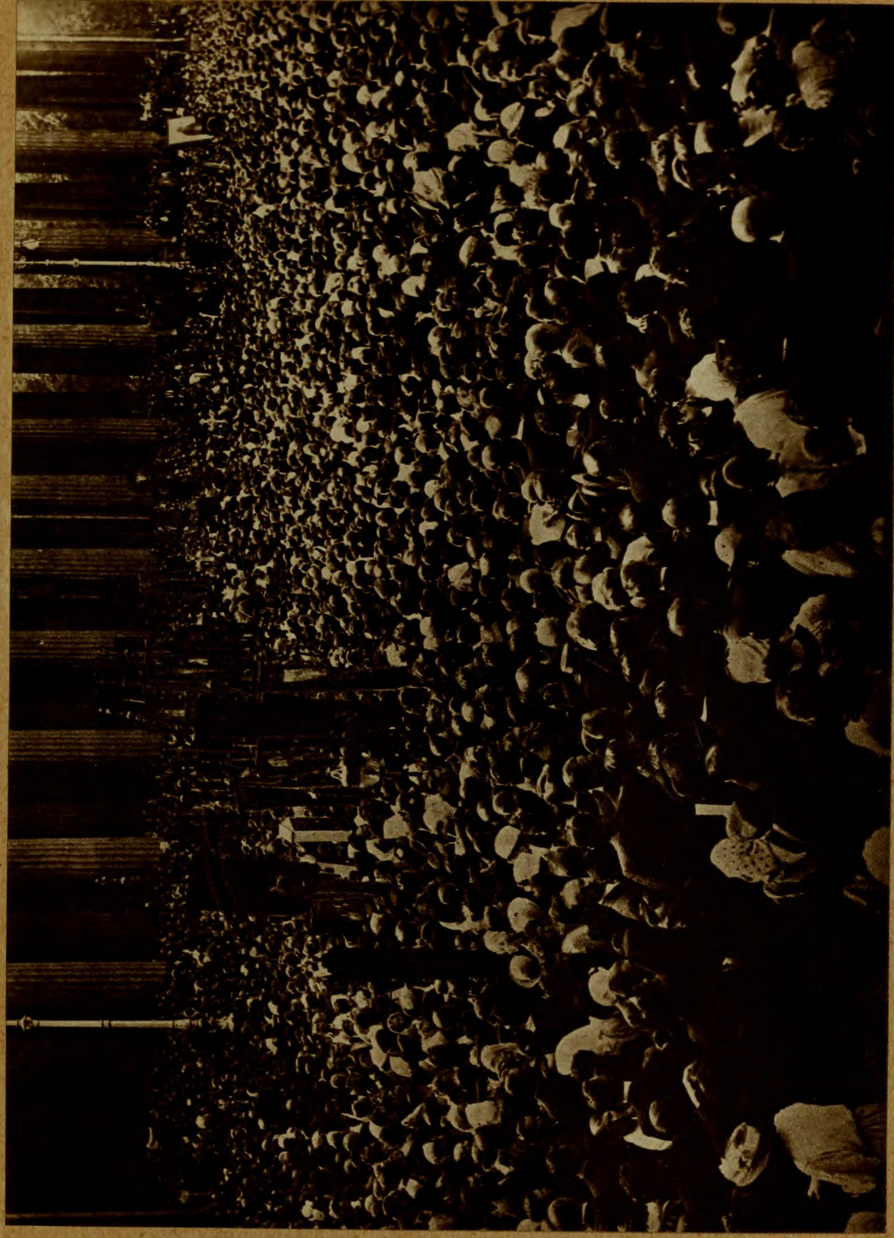
Всенародное молебствіе 8-го іюля 1915 г. въ Петроградѣ передъ Казанскимъ Соборомъ.